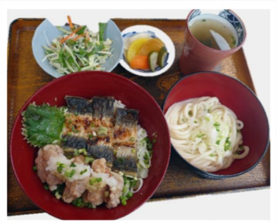
弁財天 1500 円 벤자이텐 1500