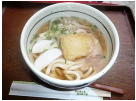
大黒うどん 550 円 다이코쿠 우동 550 엔