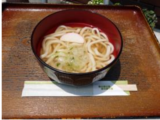
小うどん 250 円 미니우동 250 엔