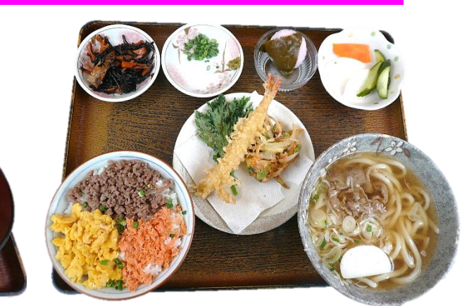
恋桜御膳 1080 円 1080 엔