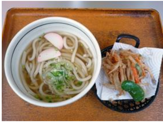
かき揚げうどん 780 円 야채튀김 우동 780 엔