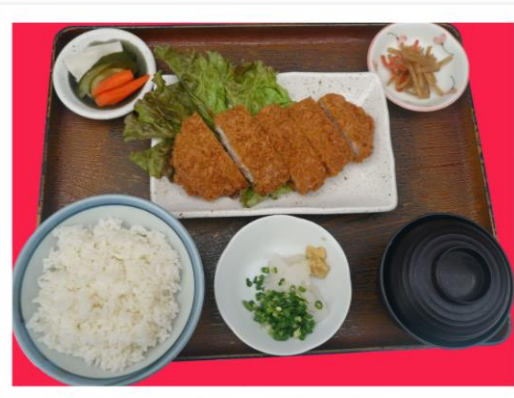
布袋御膳 1240 円 여름 한정 접대 정식 1240 엔