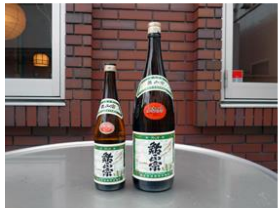
鮎正宗一合 600 円 아유 정종 1합 600 엔