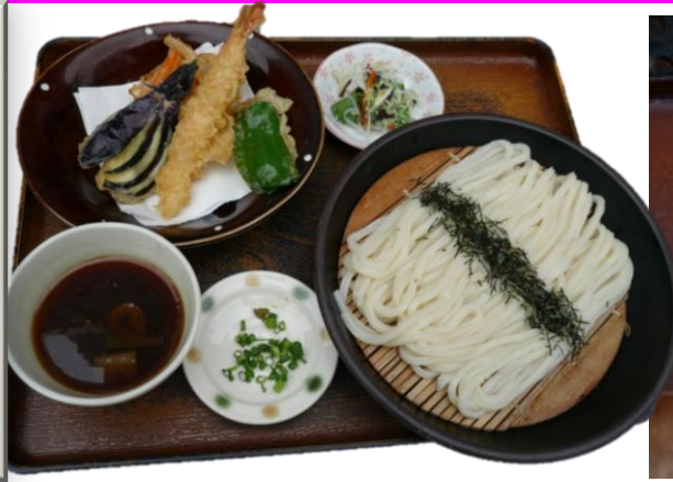
帝釈天ざる 1030 円 덴푸라 대발우동 1030 엔