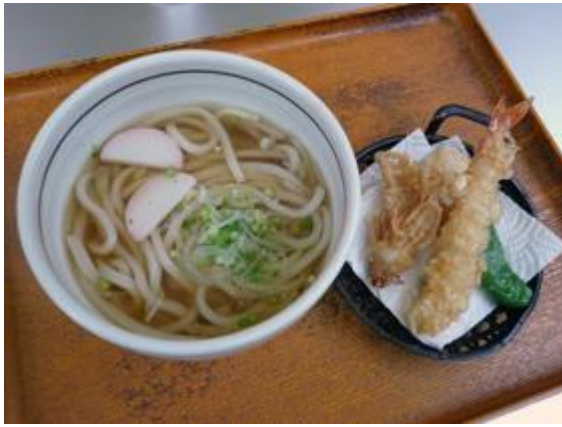
天ぷらうどん 780 円 덴푸라 우동 780 엔