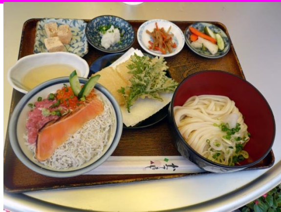
おかげさま御飯 1240 円 덕분에 감사 정식 1240 엔