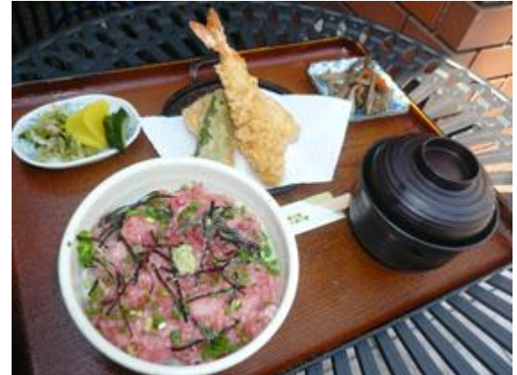
小町御膳 890 円 고마치 정식 890 엔