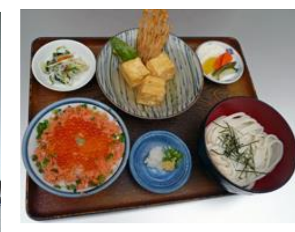
多聞天御膳 1240 円 다문텐 정식 1240 엔