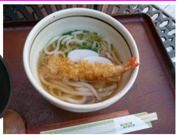
湖上うどん 550円 호상 우동 550 엔