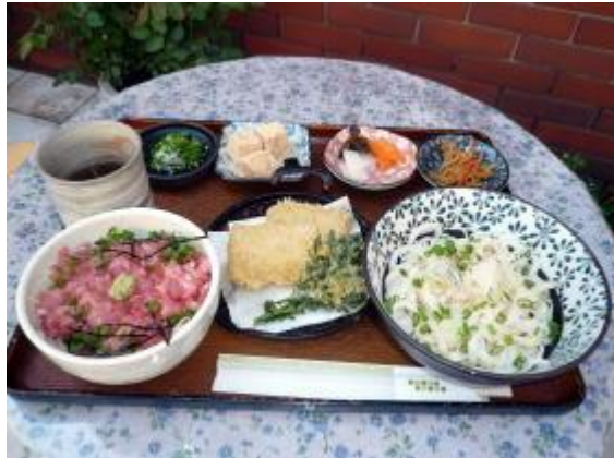
ツイてる御膳 1,030 円 운이 따라오는 정식 1,030 엔