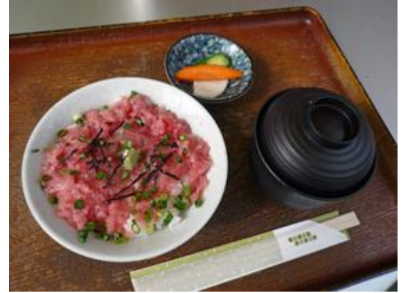
一品ネギトロ御飯 600 円 단품 파다랑어 정식 600 엔