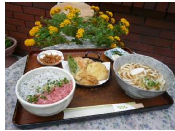
イケてる御膳 900 円 꽃꽂이 정식 900 엔