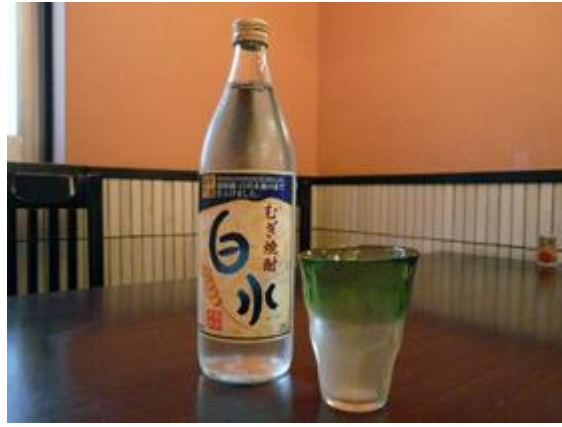
白水焼酎グラス1杯 550 円 하쿠스이 소주 1잔 550 엔