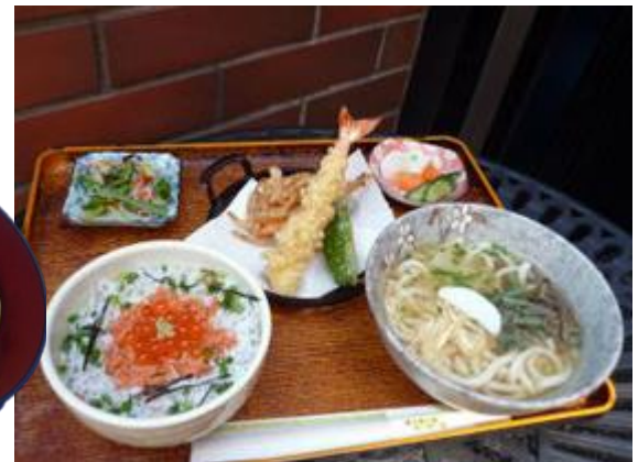
安心御膳 1030 円 안심 정식 1030 엔