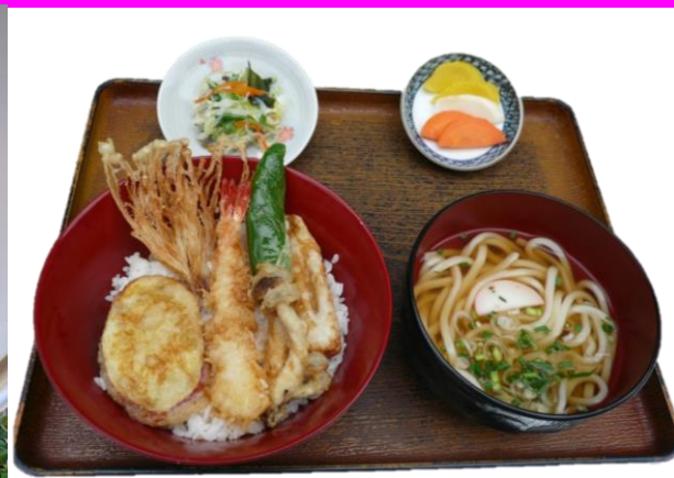
朱雀天御膳 980 円 980 엔