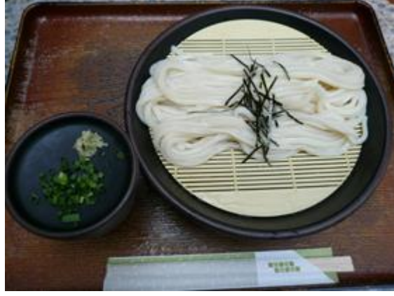
小ざる 350 円 미니 대발우동 350 엔