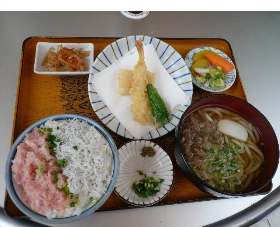
福祿寿 1080 円 후쿠로쿠주 1080 엔