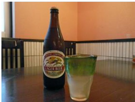
キリンビール中瓶 650 円 기린맥주 중 650 엔