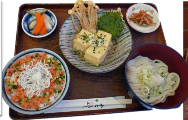
天晴御膳 900 円 감사의 마음 정식 900 엔